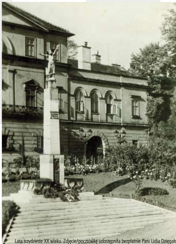
Lata trzydzieste XX wieku.