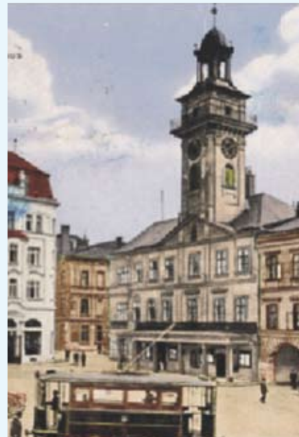
Rynek i Ratusz, Pocztówka z 1915 r.