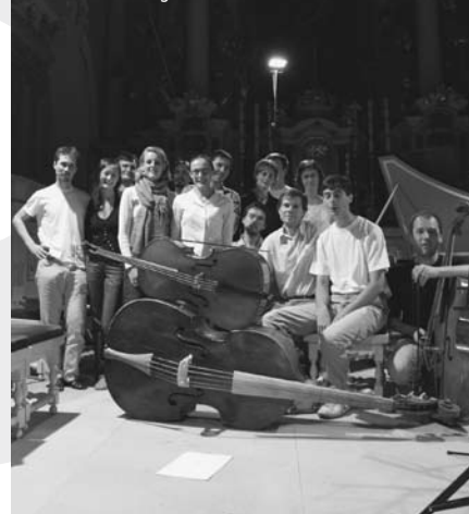
Arte dei Suonatori